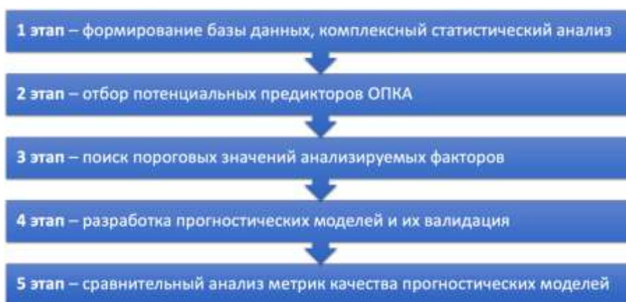
Рисунок 1 – Схема дизайна исследования

оценивали степень влияния отдельных факторов на конечную точку исследования. На третьем этапе среди выделенных потенциальных предикторов определяли пороговые значения. Целью четвертого этапа была разработка и валидация многофакторных моделей ОПКА с помощью методов МО: МЛР, SVM, случайный лес (СЛ), искусственные нейронные сети (ИНС) и стохастический градиентный бустинг (СГБ). Сравнительный анализ точности моделей проводился на 5 этапе исследования и включал оценку метрик их качества: AUC, Ac, Se, Sp. Анализ данных и разработку моделей выполняли на языке R в среде R-studio ver. 1.0.153 и на языке Python ver.3.7.4. Для построения ИНС использовали библиотеки Keras и Tensorflow.